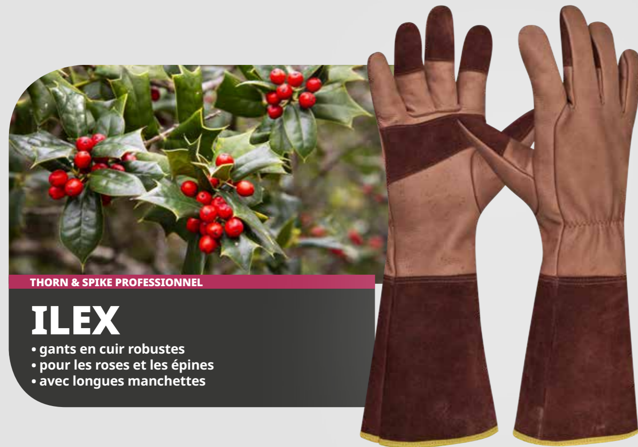
THORN & SPIKE PROFESSIONNEL